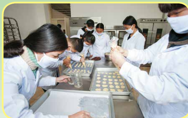
食品加工技术专业学生在上烘焙课

就业去向: 大型农产品超市、果蔬贮运公司、科研院所、食品加工企业、绿色果蔬生产基地等企事业单位从事食品的检测、生产、贮藏、加工、经营、进出口贸易的质量监督和认证管理、海关及商品检验部门、食品卫生检验; 自主创业, 从事食品的规模生产和贮运工作。