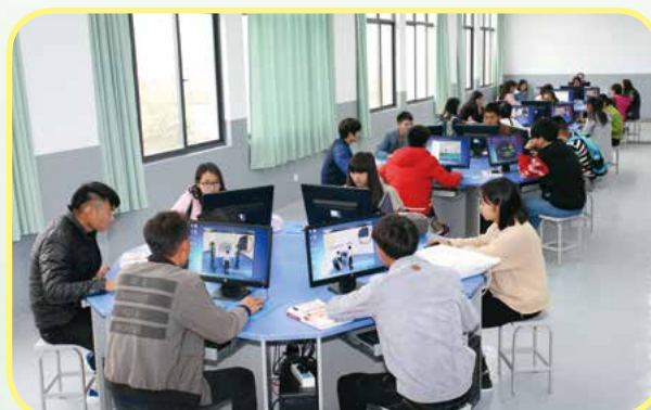
药品虚拟仿真实训室