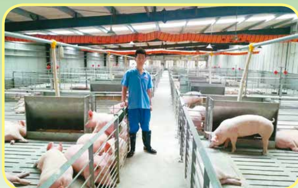
畜牧兽医专业学生到企业实习

就业方向：从事牛羊、禽、猪场设计、饲养管理和生产经营管理；牛羊、禽、猪病诊断、检疫和防治；兽药、饲料和动物保健品营销及管理等工作。