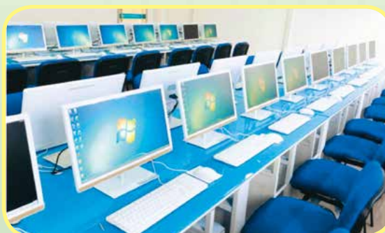
数字媒体应用技术

就业去向：影视拍摄、采编及特效制作；多媒体作品制作；平面图形、图像设计技术人员等。