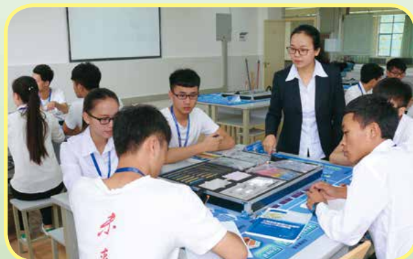
工程安全评价与监理专业的现场模拟教学

就业去向： 主要面向工程建设行业，在工程施工、监理岗位群，从事工程建设项目的安全管理、工程监理和安全评价等工作。