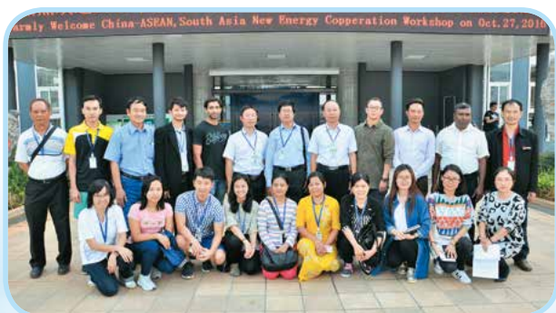
东南亚多国官员和职业院校教师到学院交流学习