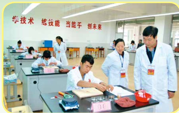
种子生产与经营技能大赛

就业去向：培养适应各级农业管理部门、种子管理单位、农业科研单位、涉农企业，从事种子生产、种苗生产、种子管理、经营、销售等技术服务及相关生产管理工作。