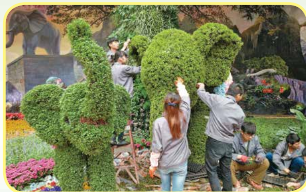
园林技术专业学生现场施工

就业去向： 到各城建部门，园林管理处，园林设计院（所），建筑公司，绿化工程公司、房地产公司、装饰公司，从事园林景观设计、方案表现、园林工程施工及项目管理等工作。