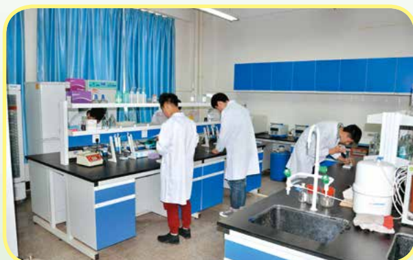
动物药学的兽药残留分析

就业方向：主要从事化学药品、中成药及饲料药物添加剂、生物制品的生产、质量监督、检验、管理和推广应用、兽药、生物制品企业市场开拓、新客户开发、兽药经销与养殖咨询工作。