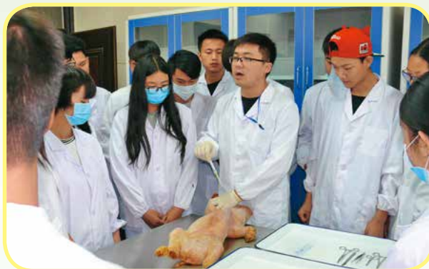
动物医学的病理剖检

就业方向：从事动物疾病诊断和防治、动物检疫和动物性食品卫生检验、宠物护理、宠物疾病诊断与防治。