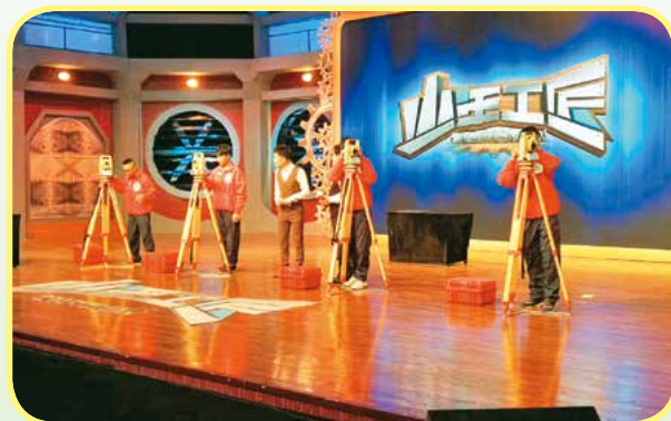
测绘工程技术专业学生在中央教育频道《少年工匠》录制现场

就业去向： 国土、测绘、规划、城建、水利、农林、环保、房地产等各类企事业单位从事满足工程建设需要的测绘、地理信息管理工作。