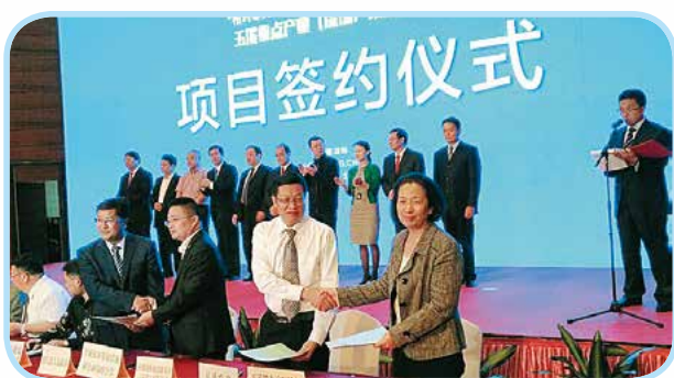
学院与深圳华大基因科技有限公司签订校企合作协议