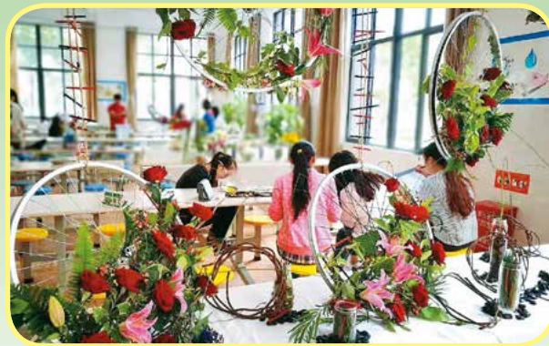
园艺技术专业学生作品

就业去向： 各级农业科研及推广单位、园林绿化站、农业观光园区、花卉企业、风景区、公园部门从事园艺产品经营及园艺资材经营；开设植物医院、家庭园艺托管等生产、科研、经营、管理工作。