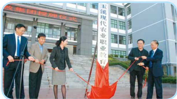
玉溪现代农业职教集团揭牌

学院加强院校合作，与中国农业大学联合举办现代远程教育，成立了中国农业大学玉溪学习中心，面对社会开展本、专科远程教育；与文山农业学校、红河州农业学校、昭通农业学校、安宁职中、晋宁职中、易门职中、华宁职中、新平职中、元江职中、澄江职中等中职学校签订联合办学协议，探索中高职衔接的模式；与云南大学、西南大学、重庆工商大学等学校联合举办本专套读、与湖南农业大学联合成立“攻读硕士学位教学站”，面向在职人员开展研究生教育、与广东科学技术职业学院、江苏食品药品职业技术学院等学校就师资培训、学生交流、专业建设等方面进行深度合作；2017年，经云南省教育厅备案批准，学院还招收了老挝、泰国等国家的留学生。