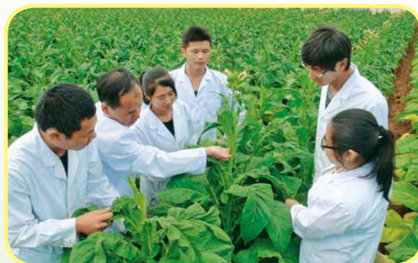
烟草栽培与加工专业教师授课

就业去向：烤烟分级岗位、烤烟烘烤岗位、烤烟辅导员、烤烟合作社管理人员、职业烟农。