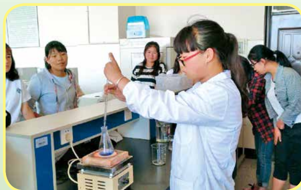
农产品加工与质量检测实训操作

就业去向：在农产品质量安全检测站、质量技术监督局、海关、工商部门、进出口商品检验检疫局、农产品加工生产企业、大型超市、农产品批发市场等相关部门，从事农产品卫生监督管理、农产品品质检测、农产品质量管理控制、质量认证等方面工作。