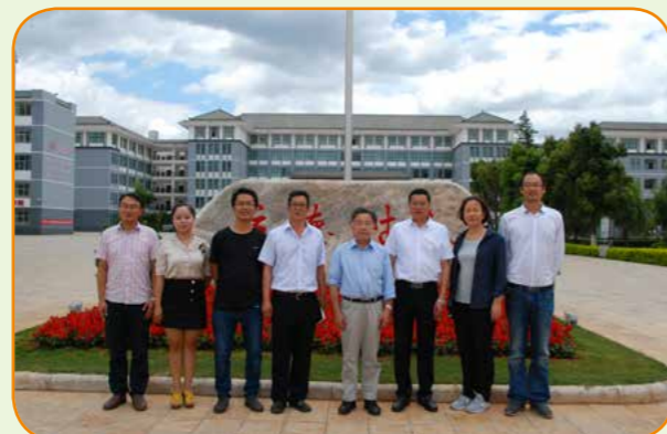
中科院院士、华大基因主席、华大基因学院院长杨焕明到访我校。

2016年在玉溪烟草职业教育集团基础上成立玉溪现代农业职业教育集团。近年来，学院与云南省烟草农业科学研究院、玉溪市烟草公司、广东温氏集团、广东东瑞集团、无锡艾迪花园酒店、昆明冠禾农业科技有限公司等单位签订长期战略合作协议，实现优势互补，资源共享、师资培训、学生交流、专业建设、合作育人。昆明冠禾农业科技有限公司、无锡艾迪花园酒店、云南恒立基础建设有限公司等企业还与学校达成冠名协议，为相关专业学生提供奖学、助学资助。