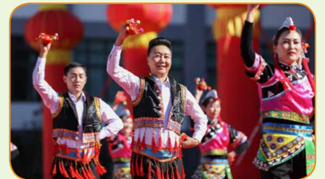
60周年校庆教师表演节目