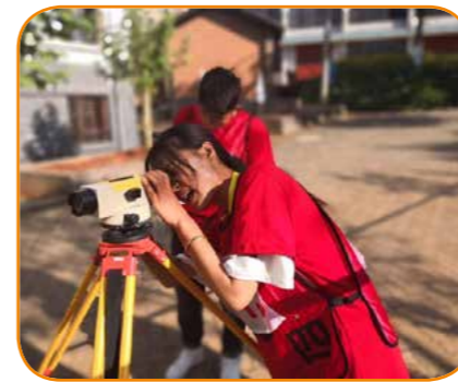
2018 年云南省中职学生技能大赛