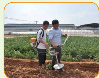
烤烟打塘机专利产品