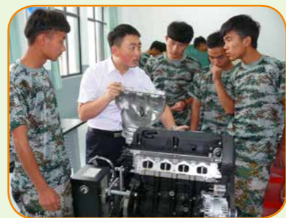
汽修专业课老师授课