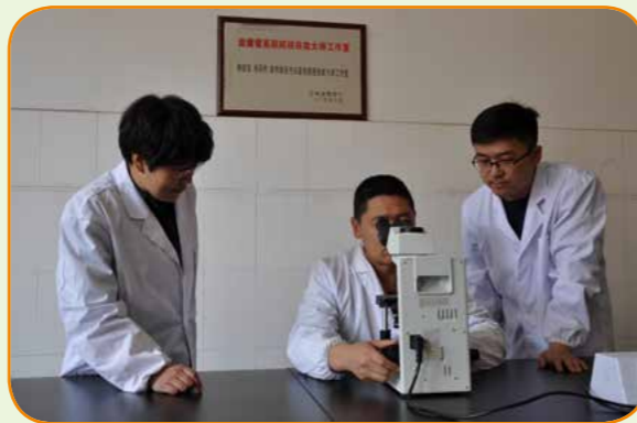
云南省技能大师工作室

从 2004 年开始学院与广东温氏等行业内知名企业合作，实行“2+1”和“教学进知名企业”人才培养模式，开设企业班（如华西德康班），实现教学与生产的完美结合，培养温氏等知名企业场长上百名、动物医院院长及畜牧兽医站站长数十名，成为中国畜牧兽医人才有影响力的培养基地。目前动物科技学院与温氏等全国 38 家知名企业签订了校企合作协议书。学生就业率达 97% 以上。