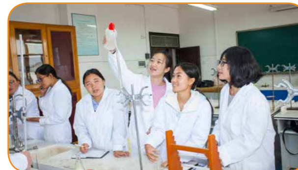
有机化学分析室 - 滴定技能训练