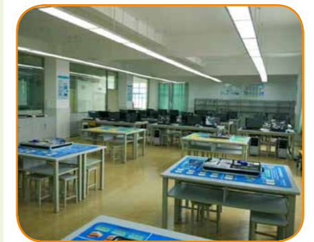
工程造价综合实训室