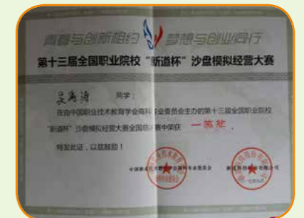
2017 新道沙盘全国一等奖