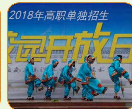
校园开放日学生表演节目