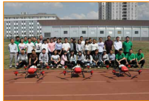
2018 年无人机培训合影

学院分别与云南省烟草农业科学研究院、玉溪市烟草公司、云南绿叶生防科技有限公司、云南冠和农业发展有限公司、昆明特益经贸有限公司、呈贡新生力农业发展有限公司、京博农化科技股份有限公司、玉溪阳瑞农业发展有限公司等十余家建立了校企合作关系，签订了实习、就业协议，毕业生直接输送到用人单位。同时与大连高富森生物科技有限公司签订食用菌技术员订单培养计划；与云南神飞航空植保技术有限公司共同免费培训机手，学生可以直接就业，实现了与企业无缝对接，学生就业率达 99% 以上。