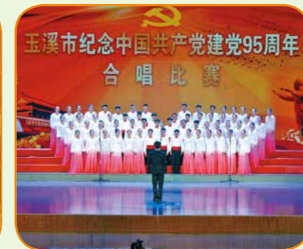
学生参加玉溪市纪念中国共产党建党95周年合唱比赛