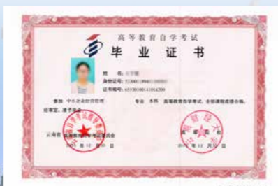
本科毕业证书图样2