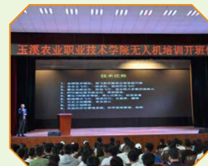
2018 年无人机培训开班仪式