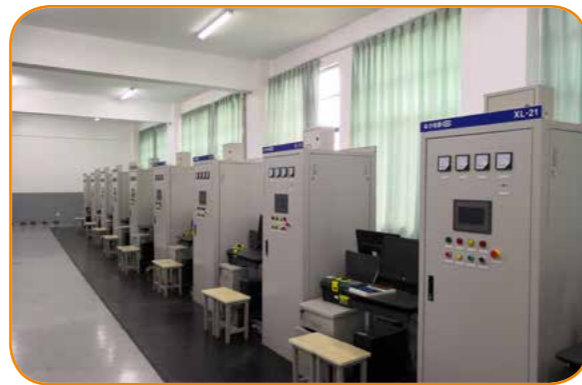
电机与电气控制实训室