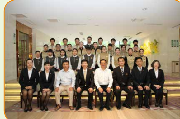
校领导看望艾迪实习学生

学院积极主动寻求合作企业，加强校企合作，先后与新道科技有限公司、玉溪本地企业通力会计师事务所、汇励会计师事务所、用达会计公司、沃尔玛、达利集团等单位签订合作协议，努力实现双方共赢，学院还与江苏无锡艾迪花园酒店实行校企联合办学、建立学生实习的合作关系，先后培养四届“艾迪”冠名班，社会技术服务活动取得了较好成效。学生就业率达 98.5%。