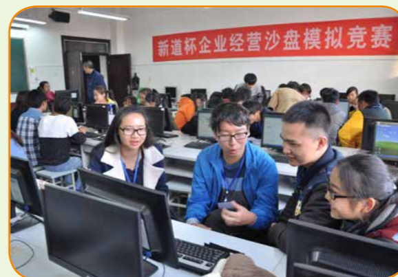
学院技能沙盘大赛