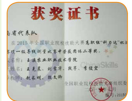
全国技能大赛获奖证书