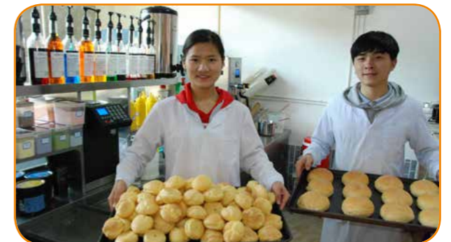
创业园烘焙实验室——烘焙技能