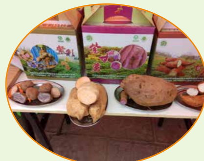
学生创业产品——紫甘薯