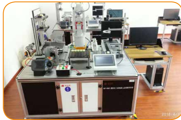
此工业机器人可实现搬运、码垛、轨迹模拟、视觉检测、追踪等功能。