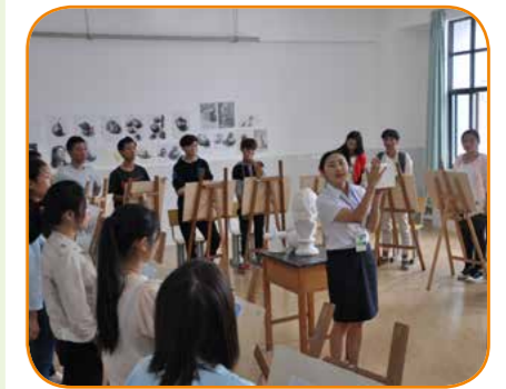
环境艺术设计教学

目前与云南利鲁建设有限公司、昆明虹之华园艺有限公司、南方测绘有限公司等 13 家单位建立了校企合作关系，签订了实习、就业协议。近五年学生就业率达 90% 以上，在园林园艺、工程测绘领域涌现了数十名创业明星。