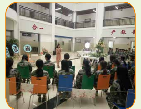
2017年5月24日晚，朗读者第六期在图书馆一楼大厅成功举办，本期的主题是青春。