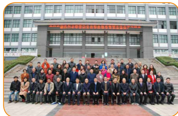
2017年玉溪现代农业职教集团年会合影

学校加强院校合作，与中国农业大学联合举办现代远程教育，成立了中国农业大学玉溪学习中心，面对社会开展本、专科远程教育；与文山农业学校、红河州农业学校、昭通农业学校、腾冲第一职业高级中学、安宁职中、晋宁职中等中职学校签订联合办学协议，探索中高职衔接的模式；与云南大学、昆明理工大学、云南财经大学等学校联合举办专本套读、与湖南农业大学联合成立“攻读硕士学位教学站”，面向在职人员开展研究生教育；与广东科学技术职业学院、江苏食品药品职业技术学院等学校就师资培训、学生交流、专业建设等方面进行深度合作；2017年，经云南省教育厅备案批准，学校开始招收老挝留学生。