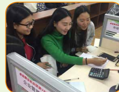
跨专业综合实训室