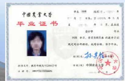
本科毕业证书图样1