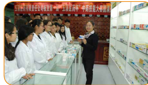
企业老师讲解药品

深化产教融合，加强校企、校校合作。与江苏食品药品职业技术学院合作，完成 4 届 149 名学生的交换培养。与玉溪医药有限责任公司、云南达利园食品有限公司、云南嘉华食品有限公司、云南猫哆哩集团有限责任公司、云南望子隆药业有限公司、云南沃森生物技术股份有限公司、玉溪安尔康健康信息咨询有限公司和昆明好自然义齿公司等企业长期密切合作。针对企业岗位需求，校企双方分段、分类、分班共同培养，学生自愿选择行政班、企业订单班、兴趣班学习，择业灵活、多样，就业渠道宽，学生就业率达 95% 以上。