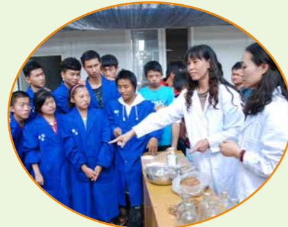
对特校学生进行食用菌技术培训