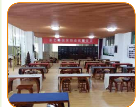
草木间茶文化研习馆