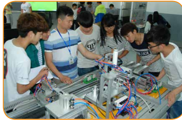
电气自动化授课中

学院毕业生的专业技能、职业精神、动手能力得到各级专家、评委、用人企业充分肯定，被企业评定为“三个特别”：特别能吃苦、特别能学习、进步特别快。学院自 1995 年招收第一届计算机应用技术专业以来，共计培养人才 2900 多人，毕业生分布于云南省各州市，在政界、商界、企业界中均有很大的发展，近年来主要就业于昆明、玉溪、楚雄、曲靖的滇中经济圈，依托省内多家 IT 类、家装类、广告类大中型企业签约合作办学，学生就业率达 95%。