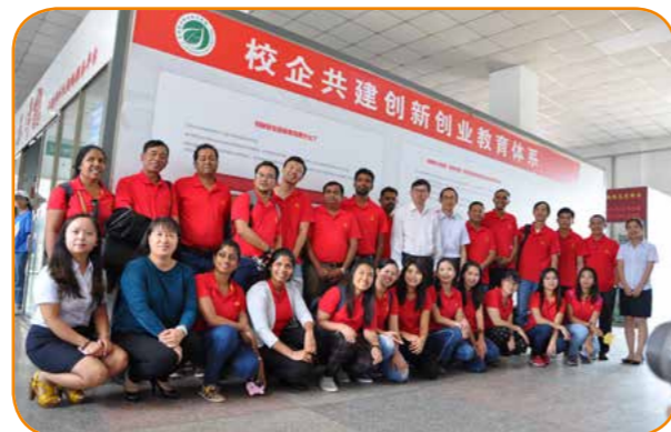
2017年6月22日至28日，学校举办了为期一周的南亚、东南亚植物药适用技术培训班。

近年来，学校不断提升国际交流合作的层次、构建对外合作的新格局、增强对外合作水平。作为澜湄职业教育联盟理事单位，大力开展国际交流合作，面向南亚、东南亚国家开展短期培训，响应国家一带一路战略，开展东南亚留学生培养工作，学校共有4名老挝籍留学生，1名泰国籍留学生；与尼泊尔科研机构联合，开展国际科研教育合作。