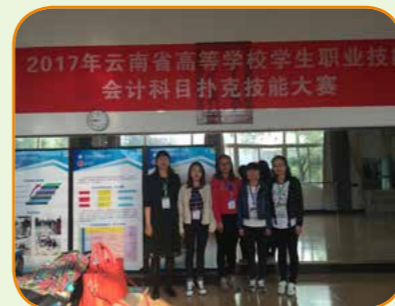
2017 年会计科目扑克省赛两个三等奖