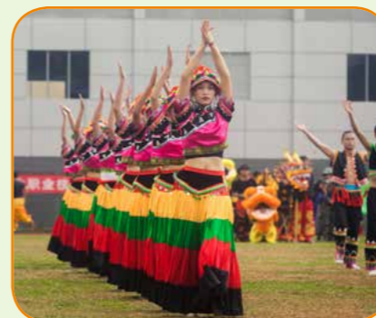
体育艺术节文艺表演