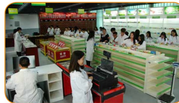
模拟药房实训室药品综合实训