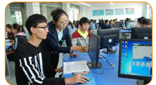
药品虚拟生产实训室