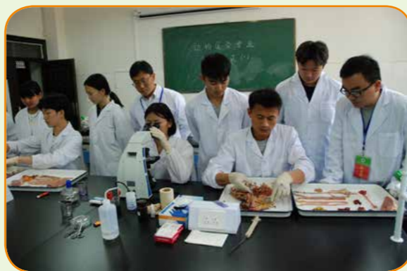
鸡的病理解剖与镜检技能比赛