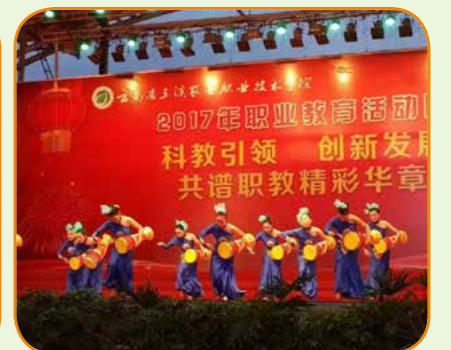
聂耳文化广场活动